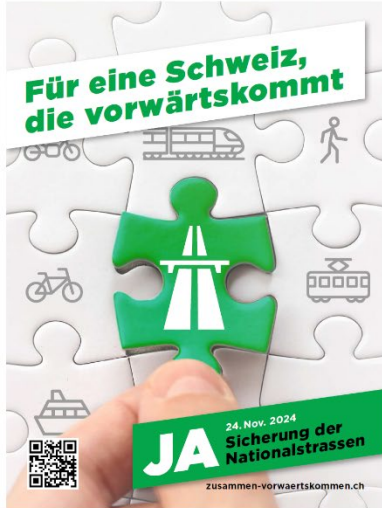
Flyer (Wickelfalz A5)